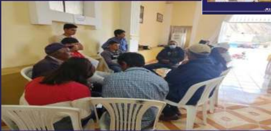
COMISIÓN ASENTAMIENTOS HUMANOS