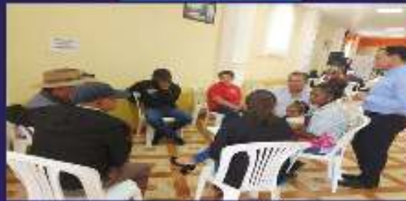
COMISIÓN ECONÓMICO PRODUCTIVO