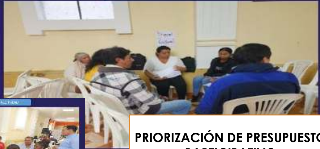
COMISIÓN SOCIO CULTURAL