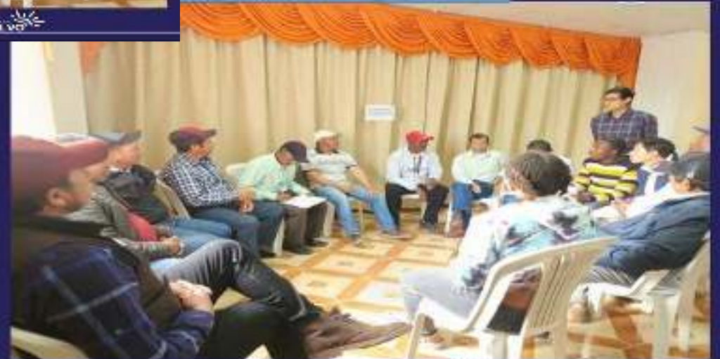
COMISIÓN ECONÓMICO PRODUCTIVO